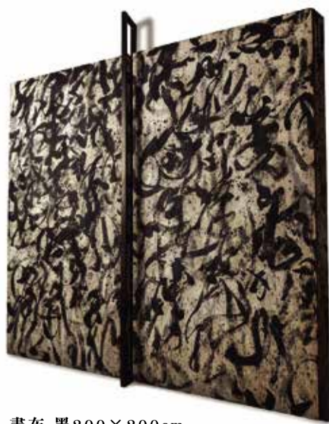
畫布 墨 200×200cm

返台至今二十年的創作歷程中，常思索著如何透過繪畫的語言形式，使筆觸、線條、顏色等形與色之間的關係不僅相互依存，更可以獨立存在；更嘗試著讓繪畫的元素能與所在的空間產生對話，探討平面繪畫與立體雕塑之間的另一種可能性。除了呼應西方抽象表現主義中，行動繪畫、幾何表現、單色表現的思維外，並對材料本身與基底材的物質性空間進行一連串實驗與提問。