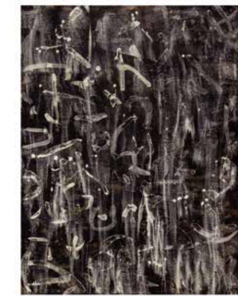
畫布 墨 120×90cm

面臨當代藝術創作的百家爭鳴，筆者只想回歸本質，追本溯源，期望作品能突破「東、西」的藩籬，呈現屬於自己的面貌與風格。最後引了衍庸的一句話做為結語： 「我的一筆畫並非只追求事務的逼真寫實，而是要賦予它們屬於自己的生命。」