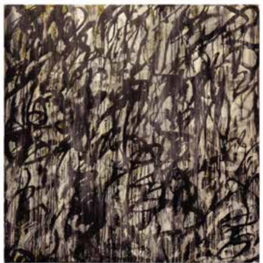
畫布 墨 160×160cm

中國山水畫，除了體現了傳統中國人對天地自然萬物的崇敬，更展現了獨特的東方藝術美學的精神涵養，其中「筆法」與「皴法」的展現與運用，更是架構這精神的基石。傳統的中國繪畫強調「書畫同源」，意指書法與繪畫相輔相成的關係，尤其書畫在筆墨的運用上，具有共同的規律。「皴法」源自於畫家對自然的觀察與體悟，傳承千年至今，「筆法」除了是東方特有的書寫與繪畫藝術的呈現方式，更是書畫家體現內在修為的一種方式。