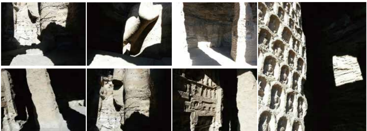
雲岡石窟之行是一場光影嬉戲。