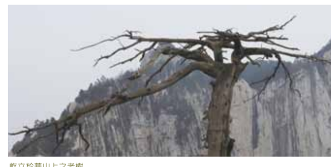
屹立於華山上之老樹