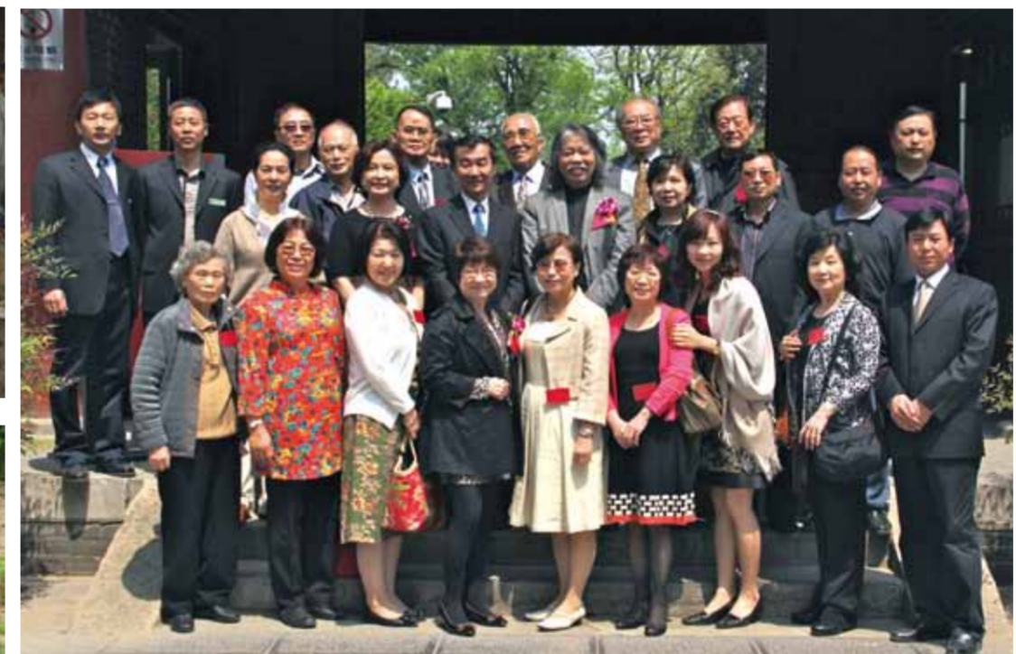
代表團與西安碑林博物館館長及同仁合影