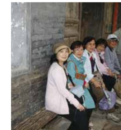
坐在黨家村古榕上唱歌劇