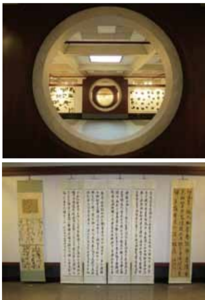
上、下圖一中港區藝術中心展場