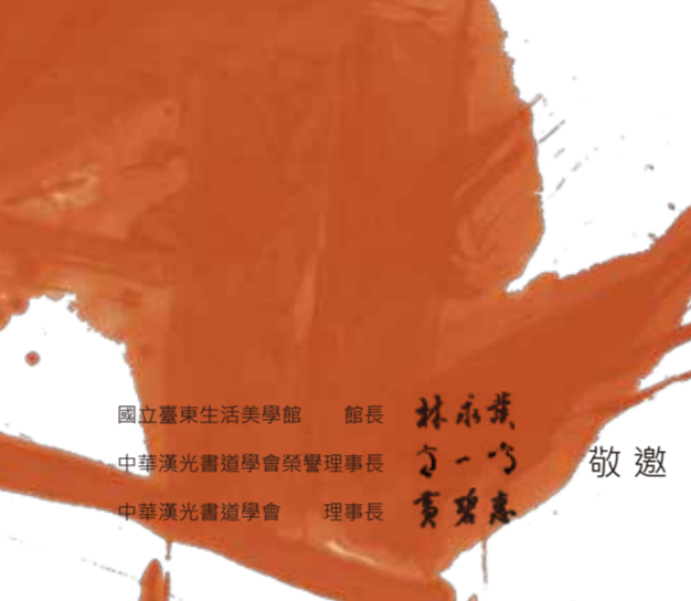
從傳統經典作品中汲取精華，讓複雜的心緒融入簡單的線條裡，藉由書法不同字體的變化體會書寫的趣味，尋找出具有新穎、開創性又能滿足自己調性的書風，經由線條的內涵與筋骨血內的變化，重新詮釋書法可能的抽象表現。