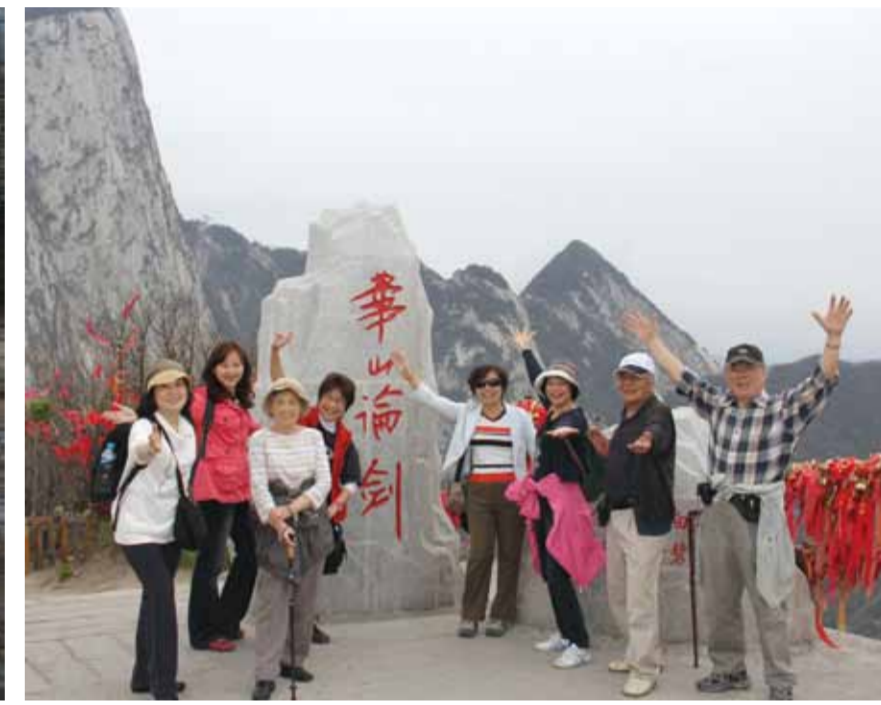
攻頂華山比手繪劍